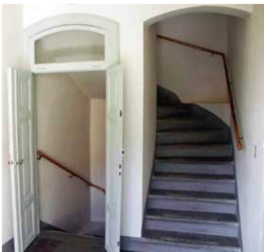
Trappan i norra flygeln, ombyggd på 1850-talet.

Trots att Hessensteniska huset har anpassats till statligt ämbetsverk är det fortfarande möjligt att