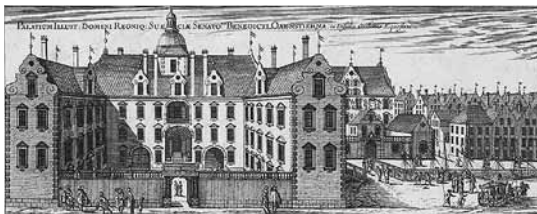
Bengt Oxenstiernas palats på Riddarholmen i ursprunglig renässansgestaltning. Ur Suecia antiqua et hodierna, 1660-talet.

Bengt Oxenstierna utsågs 1627 till riksstallmästare och gifte sig 1633 med grevinnan Margareta Brahe. Knapphändiga arkivhandlingar talar för att palatsbygget stod uppmurat i mitten av 1630-talet.