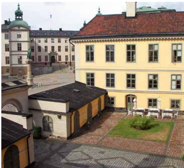
Gården fick en dekorativ stenläggning 1923 efter förslag av arkitekten Nils Blank.