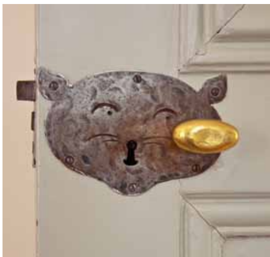
Nyckelskylt formad som ett lekfullt katthuvud till en av husets tidigare barnkammare.