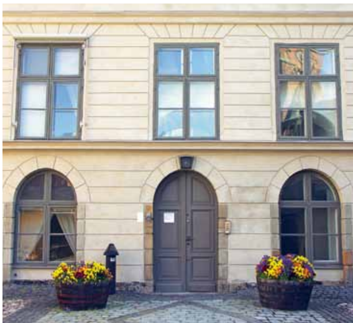
Gårdsingången till huvudtrappan visar Leijonankers ambition att mjuka upp husets gustavianska strama yttre med en dekorativ rustisering i puts.