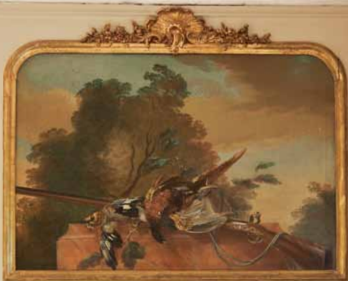
Dörröverstycke i den tidigare matsalen, tavla av hovmålaren Johan Pasch med jaktmotiv, 1730–40-talet.